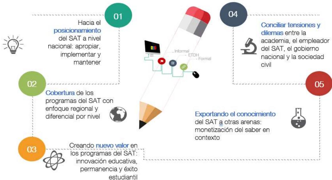
Figura 5. Cursos de acción estratégicos para la formación del SAT

La estrategia propone cinco cursos de acción estratégicos que atienden los objetivos de fortalecimiento de la educación formal, no formal (ETDH) e informal para cerrar las brechas de cantidad, calidad y pertinencia del capital humano descritas en el capítulo 1 de este documento. Las líneas estratégicas se desarrollan de manera secuencial y en la medida en que obtienen resultados, permiten a la gobernanza de la formación del SAT ajustar los programas, proyectos e iniciativas en las regiones para optimizar el uso de los recursos y alcanzar el logro de las metas e indicadores que se deben definir en el Cuadro de Mando Integral de la formación en administración del territorio.